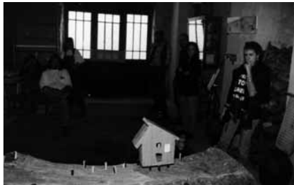
Miembros del Encuentro ante "Refugio", de Fernando Méndez Alcalde.