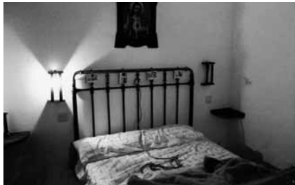
"Escapando de un pasado" de Helena Ripa.