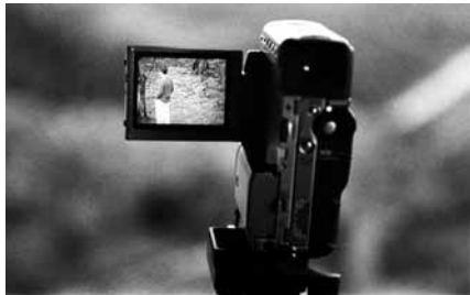
"Proceso creativo". Video-documento. Juárez & Palmero.