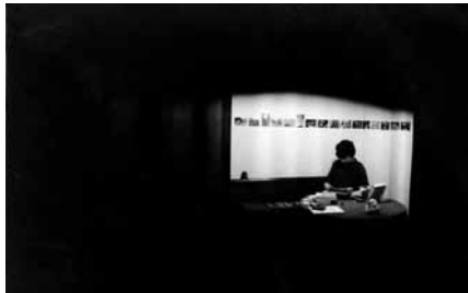
Sala de documentación, exposición V Encuentro.