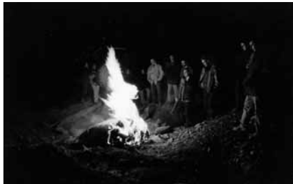
Participantes del VI Encuentro ante una intervención en el espacio.