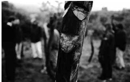
Participantes del VII Encuentro observando la obra de Ramón Martín.