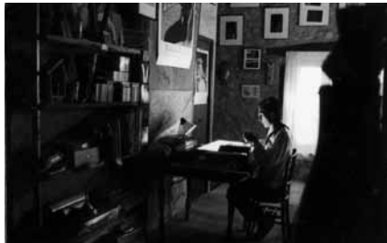
Carlos Beltrán preparando su proyección de diapositivas.