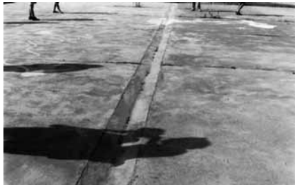
"El norte o la identificación de la Estrella Polar" de Isabel Sastre Fraile.