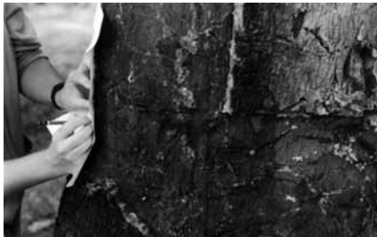
Isabel Sastre Fraile recogiendo huellas y material para su instalación.