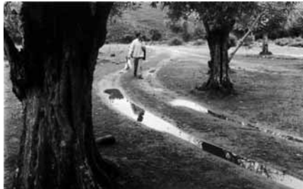
Recogiendo material en el olivar de Cavaloria. Alfredo Omaña.